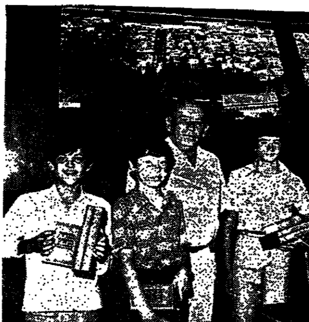
אביבה מבני זללים של מלחמת יום הכיפורים, מתוך טקס שנערך ביום ראשון במבנה המנהלה של משרד ראש הממשלה, בהשתתפות ראש הממשלה גולדה מאיר, שרת ושרי הממשלה.

(9) - בני ברק, 18 בספטמבר. ראיון עם גולדה מאיר, ראש ממשלת ישראל, נערך היום בחדר העיתונות של משרד ראש הממשלה. גולדה נשאלה על הצעתה להסדרת השלום עם מצרים, וטענה כי היא מוכנה להסדרת השלום על בסיס של שטחים תמורת שלום. היא הדגישה כי אין לה שום כוונה להעלות על בריקאדות. גולדה נשאלה גם על הצעתה להסדרת השלום עם סוריה, וטענה כי היא מוכנה להסדרת השלום על בסיס של שטחים תמורת שלום. היא הדגישה כי אין לה שום כוונה להעלות על בריקאדות.